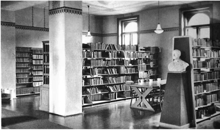
A Báró Eötvös József Collegium nagy könyvtárterme