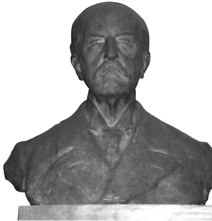
Mednyánszky Dénes szobra

A következő levél némi magyarázatot kíván: BG úr régóta óhajtott volt Mednyánszky báró szobrát elkészíttetni és azt a leendő új épület könyvtártermében elhelyezni, hogy az ifjúságot mindenkor köteles hálára emlékeztesse „legnagyobb jótevője” iránt. Ennek anyagi fedezete is rendelkezésre állott, így levelezésük másik „vonulata” ez időben a szobor gyakorlati megvalósításával volt kapcsolatos.